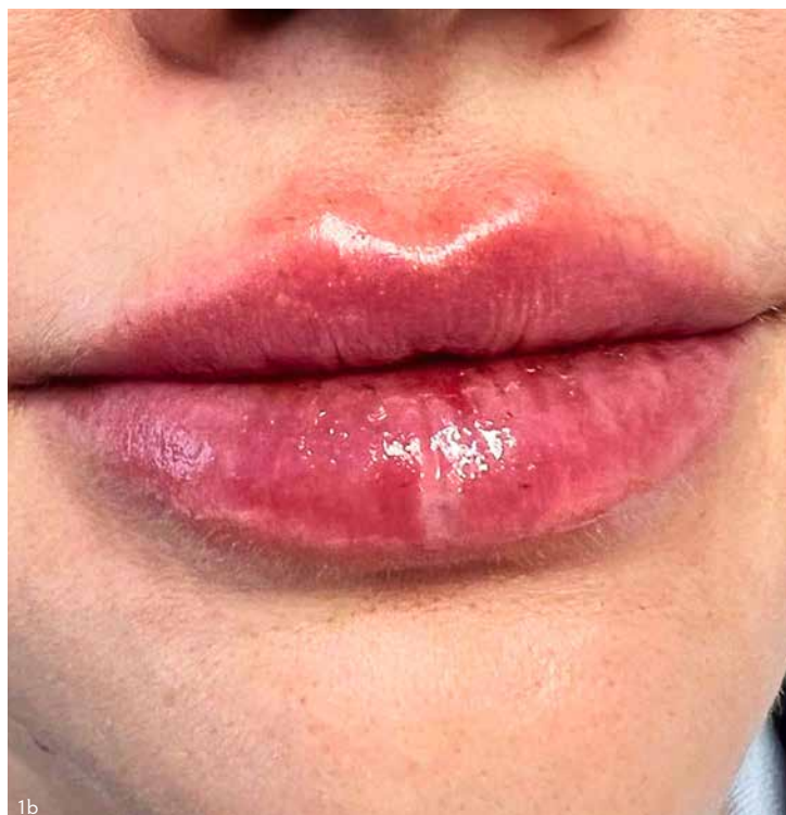
Фото 1. Клинический случай № 1. А — до процедуры, б — сразу после