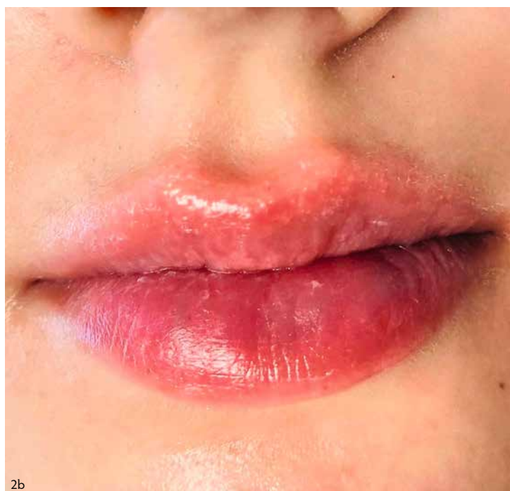
Фото 2. Клинический случай № 2. А — до процедуры, б — сразу после

проведение агрессивных процедур (чистка, массаж, пилинг и другие), приём препаратов, разжижающих кровь, переохлаждение или сильное термическое воздействие на зону вмешательства.